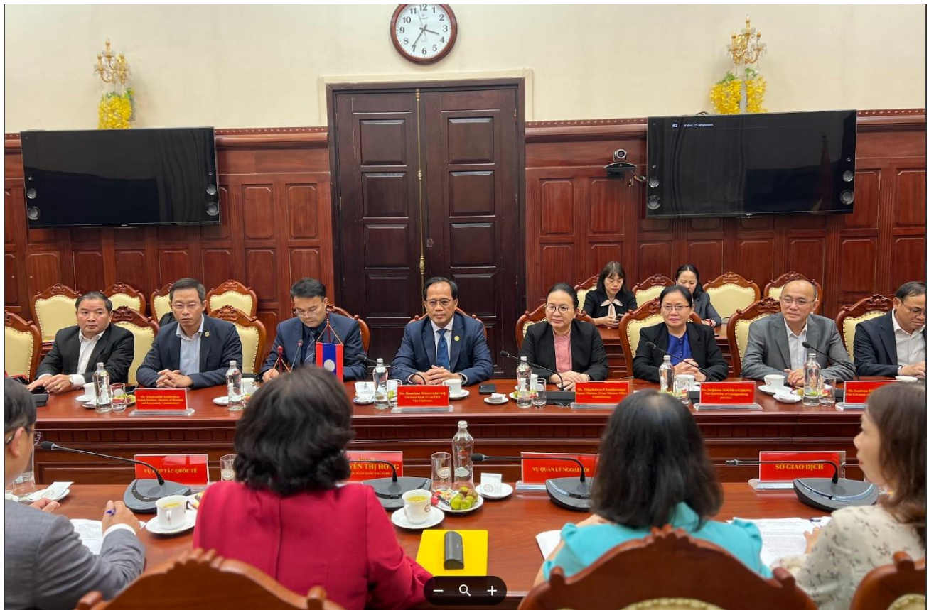
# ຂ່າວ-ພາບ: ສຳນັກງານຄະນະກຳມະການຄຸ້ມຄອງຫຼັກຊັບ.

ເສດຖະກິດລາວຈະເຂັ້ມແຂງ ຖ້າປວງຊົນຮ່ວມແຮງນຳໃຊ້ເງິນກີບ