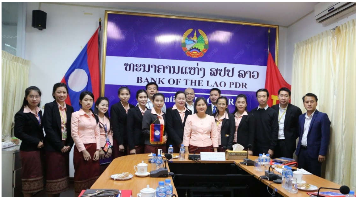
# ຂ່າວ-ພາບ: ສົມອິກ ເຄນຄຳແພງ

ໃນຕອນທ້າຍກອງປະຊຸມ ທ່ານຫົວໜ້າກົມຮ່ວມມືສາກົນ, ທຫລ ໄດ້ຕີລາຄາສູງຕໍ່ກອງປະຊຸມຂອງ 2 ຝ່າຍດັ່ງກ່າວ ເຊິ່ງເປັນການເປີດທາງໃຫ້ທັງມີການສະເໜີບັນຫາ ແລະ ຄົ້ນຄວ້າວິທີການປັບປຸງວຽກງານໃຫ້ແທດເໝາະກັບສະພາບຕົວຈິງ ເຊິ່ງເປັນພື້ນຖານໃນການຮ່ວມມືໃນລວງເລິກໃນຕໍ່ໜ້າ.