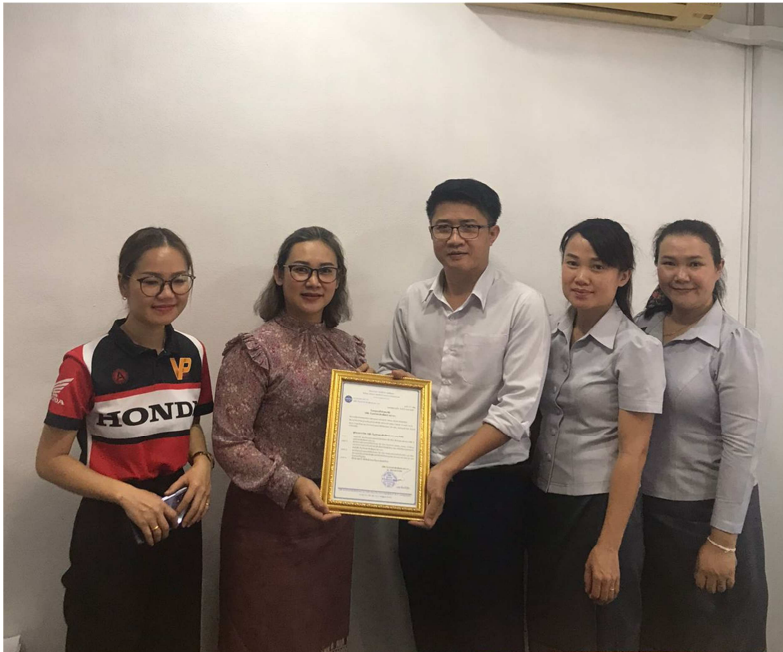
#ພາບ-ຂ່າວ: ພະແນກກວດກາ ແລະ ແກ້ໄຂຂໍ້ມູນ