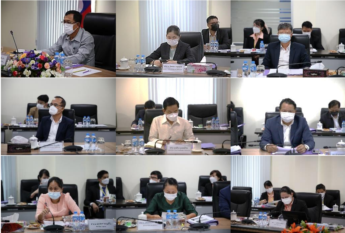
#ຂ່າວ ແລະ ພາບໂດຍ: ນາງ ປາໃນ ພັນທະລາ

ຄະນະກຳມະການຄຸ້ມຄອງຫຼັກຊັບທັງໝົດ ທີ່ໄດ້ປະກອບສ່ວນເຮັດໃຫ້ກອງປະຊຸມໃນຄັ້ງນີ້ ດຳເນີນໄປດ້ວຍຜົນສຳເລັດ ຢ່າງຈິບງາມຕາມຈຸດປະສົງ ແລະ ລະດັບຄາດໝາຍທີ່ໄດ້ກຳນົດໄວ້ ແລະ ເພື່ອສືບຕໍ່ຈັດຕັ້ງປະຕິບັດວຽກງານຄຸ້ມຄອງຫຼັກ ຊັບໃຫ້ໜັກແໜ້ນເຂັ້ມແຂງກວ່າເກົ່າ.