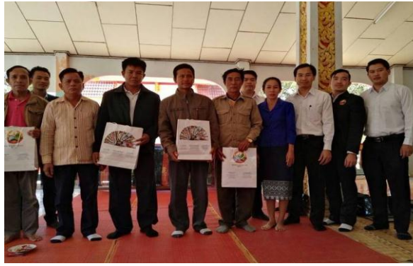
ຂ່າວໂດຍ: ສິລິພອນ ຄຳສິດາ